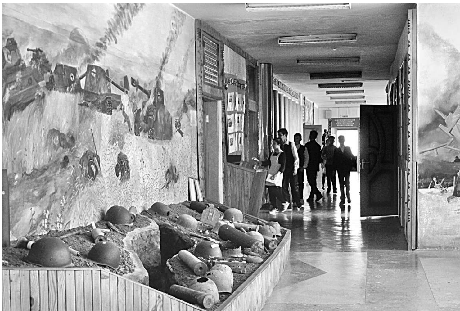
Школьный музей Великой Отчужденной войны