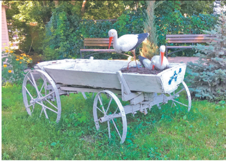
Центр образования № 1 г. Белгорода