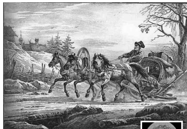
Настоящая кибитка — это крытая повозка, как на этой литографии Александра Орловского «Путешественник в кибитке, или Сани, запряжённые тройкой» (1819, Киевская картинная галерея)

Другие ученики назвали кибитку «птичкой», летящей с Кубы и крыльями поднимающей снег; «поездом, который очень быстро едет, и поэтому снег летит вверх и вниз» и даже «кибернетической, шустрой тёткой». Ямщик, по их мнению, оказался «дядей, профессия которого — таскать ящики»; человеком, роющим ямы, вероятно, карликом, «потому что сидит на чём-то маленьком и прячется в ямку».