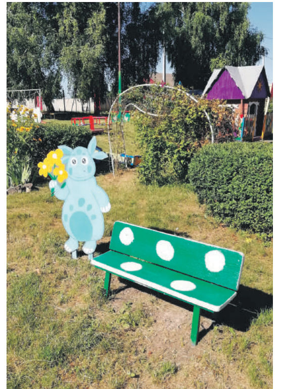
Детсад № 4 с. Алексеевка Корочанского района