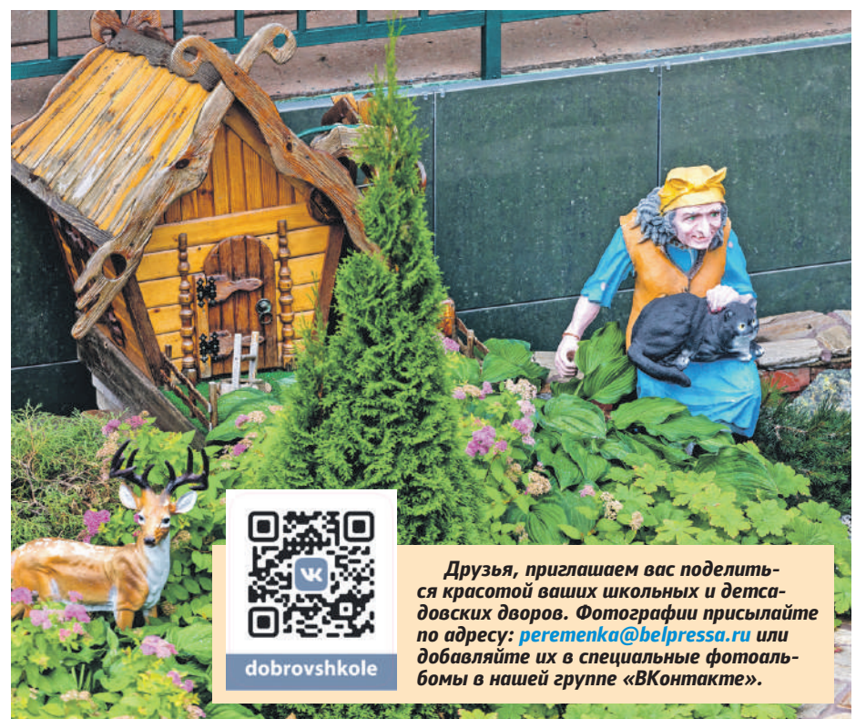
Школа № 41 г. Белгорода