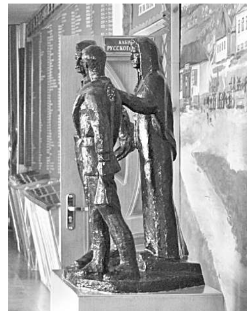
Школьный музей Великой Отечественной войны

Уверена в том, что в школе всегда ведущей и главной должна быть функция воспитания, ответственности за формирование человеческой личности. В детях необходимо формировать нравственные принципы, делая это незаметно и каждодневно. В нашей школе детей и педагогов связывают