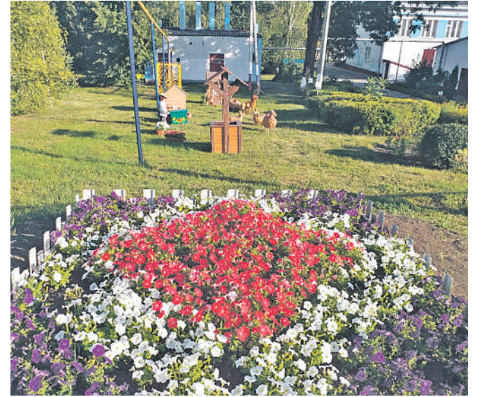
Старобезгинская школа Новооскольского городского округа