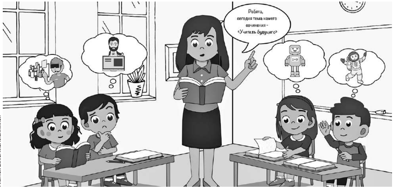
РИСУНОК ЕКАТЕРИНЫ КАСАКИНОЙ

Общая сумма выделенных средств — 10 млн рублей. Из них федеральное финансирование — около 8,5 млн. Почти 1,4 млн —