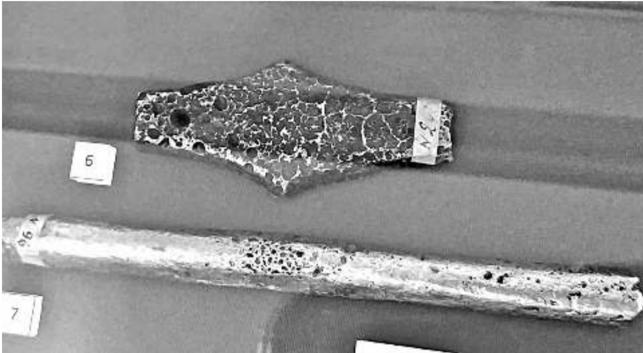
Платёжные слитки Древней Руси

В Белгороде экспонируется уникальная выставка, посвящённая истории России