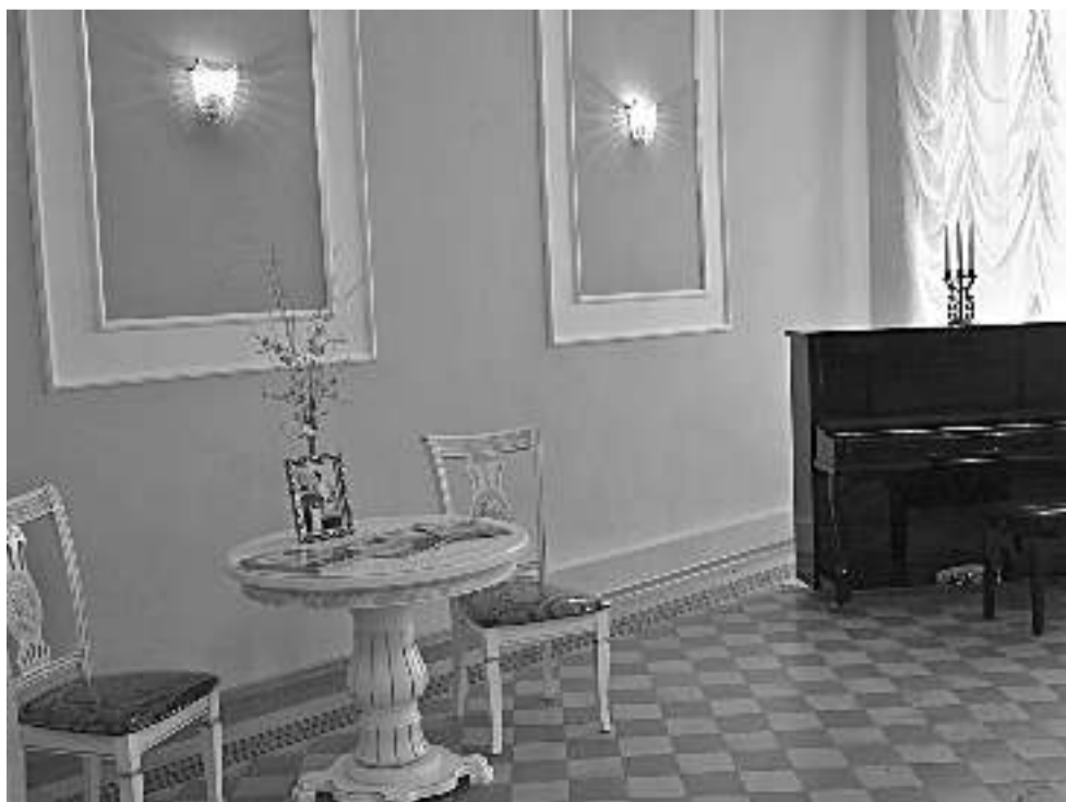
Ольгинский зал школы № 1