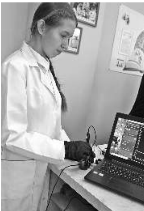
В школе № 1

КОЛЛЕГИ! МЫ ПРИГЛАШАЕМ ВАС СТАТЬ НЕ ТОЛЬКО ЧИТАТЕЛЯМИ, НО И АВТОРАМИ ГАЗЕТЫ!