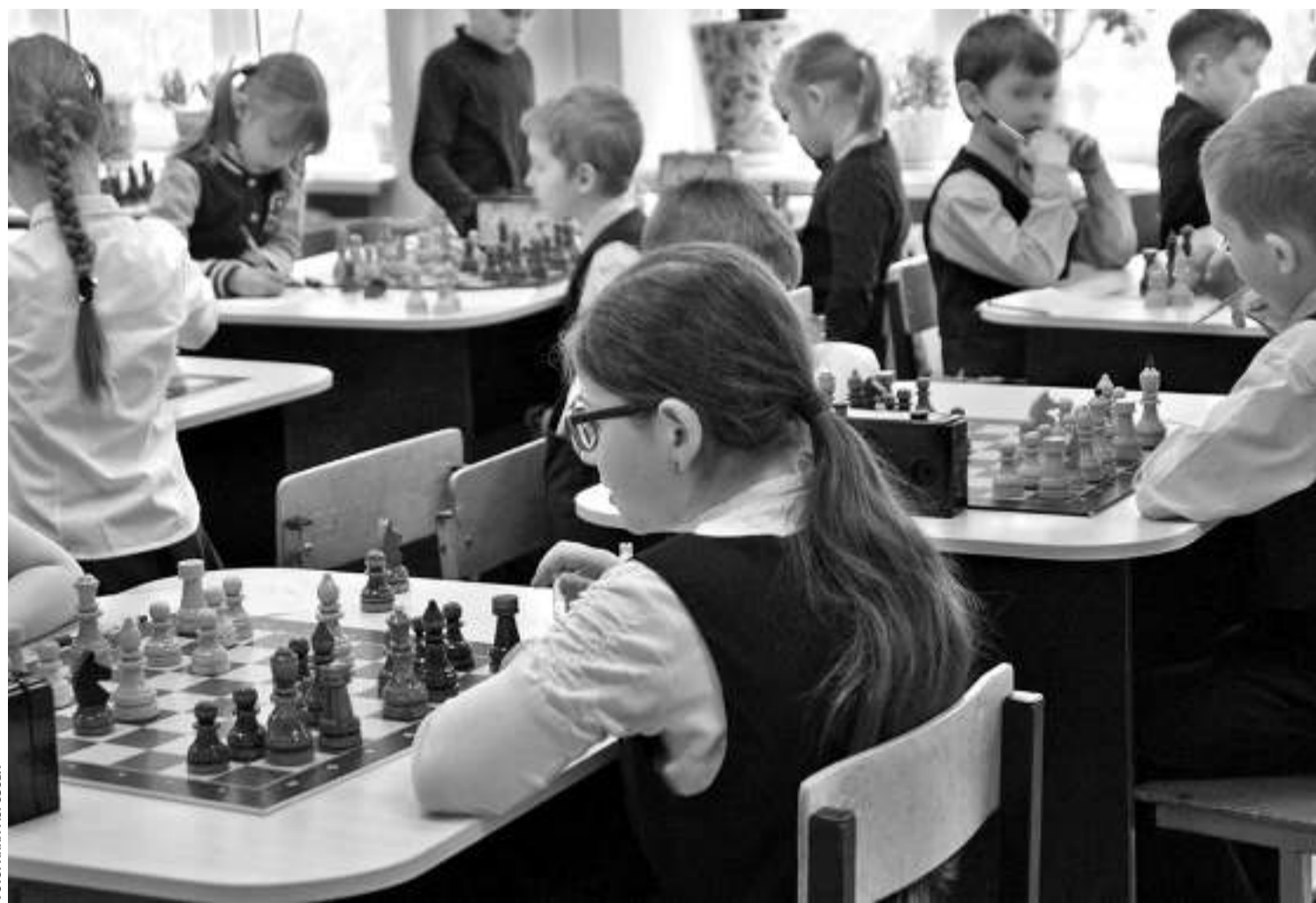
В образовательном комплексе «Луч»

— Высокий уровень локального нормотворчества. В этих учебных заведениях есть хорошо проработанные локальные нормативные акты, которые обрабатывают порядок. Основные образовательные программы и программы развития направлены на активное познание мира, развитие учебно-исследова-