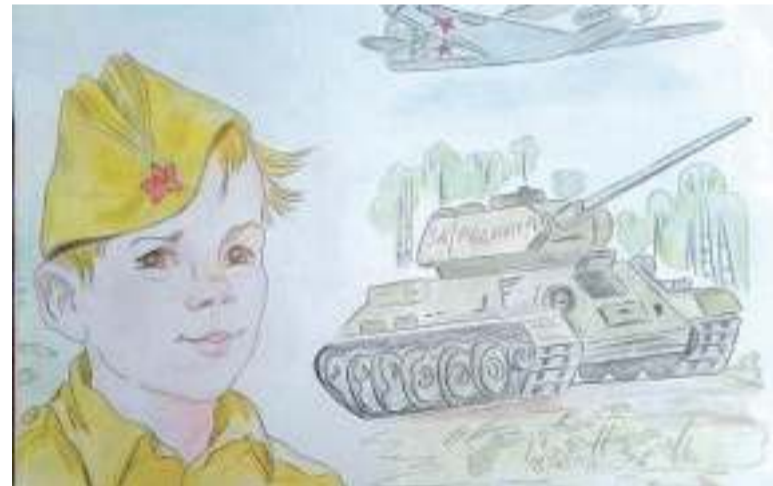
Рисунок Дарьи Лопиной (Корочанская школа им. Д. Кромского)