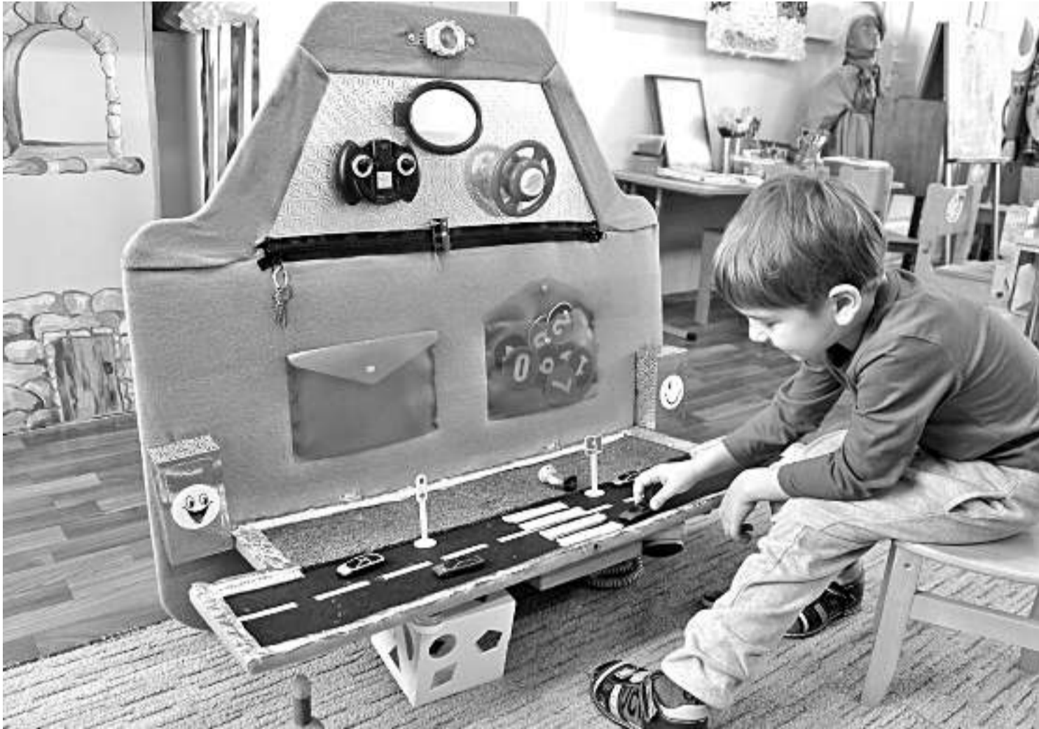
Игровая зона в детском саду № 8

СЕГОДНЯ СВОИМ ОПЫТОМ ДЕЛЯТСЯ УЧРЕЖДЕНИЯ ОБРАЗОВАНИЯ НОВООСКОЛЬСКОГО ГОРОДСКОГО ОКРУГА