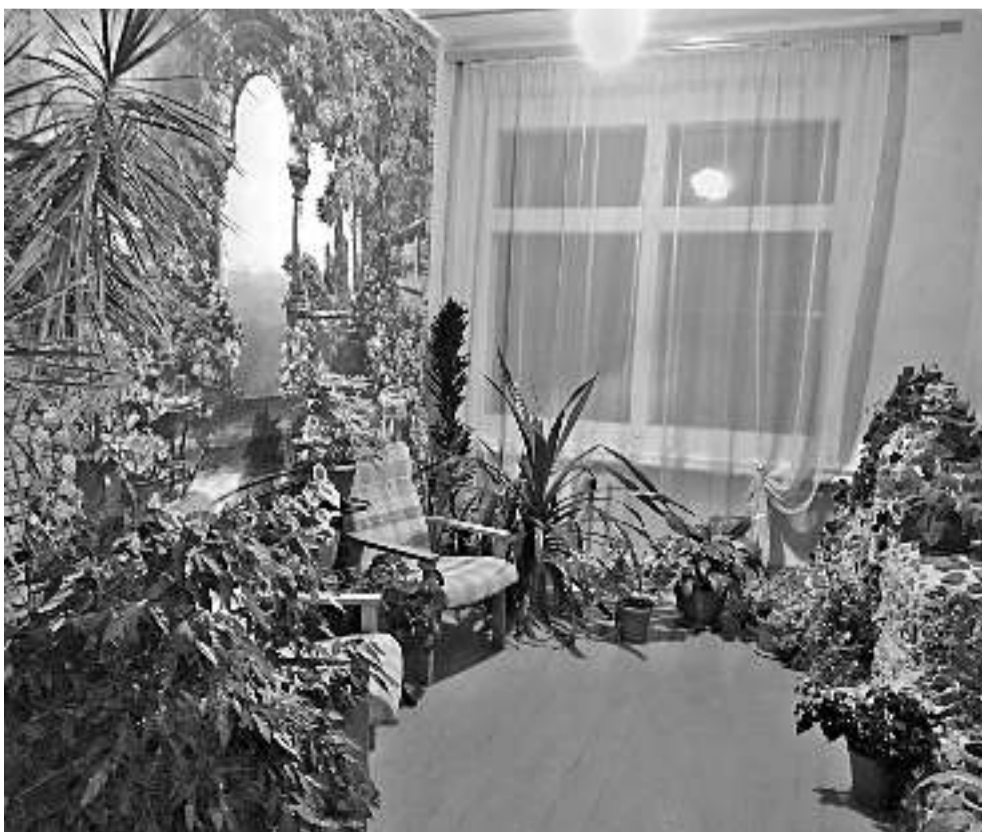
Зимний сад в Васильдольской школе