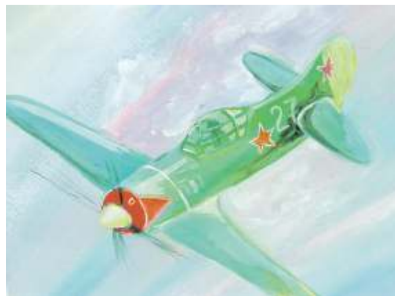
Воздушный бой. Рисунок Дмитрия Новикова (Корочанская школа им. Д. Кромского)