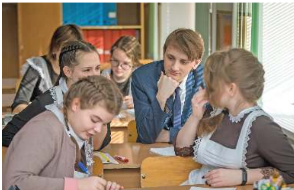
Урок обществознания в 10-м «Б» классе

Ольга МУШТАЕВА » ТЕКСТ