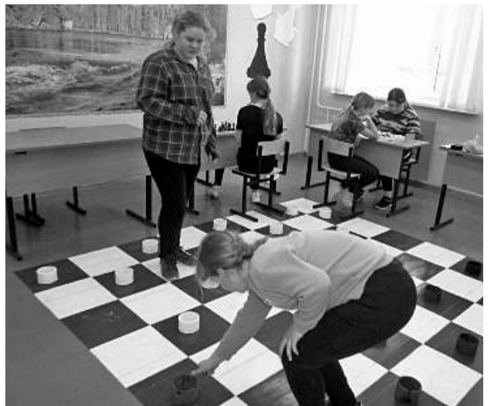
Игровая зона в Глинской школе