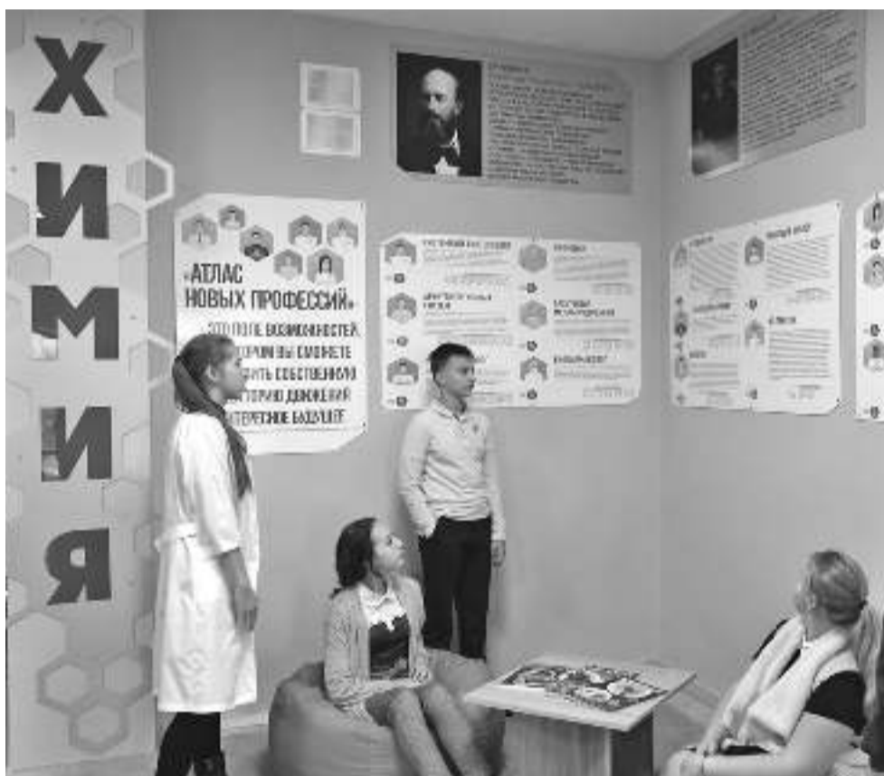
Профориентационная зона в школе № 1