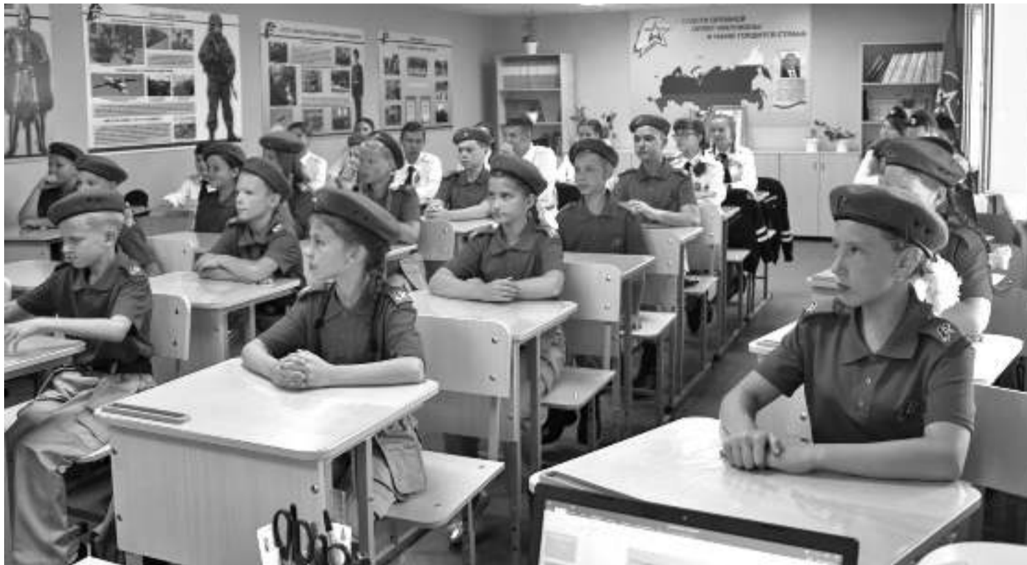
Кадетский класс школы № 1

В результате реализации проекта в школе создали лабораторию, которую можно без преувеличения назвать кузницей пытливых, талантливых юных исследователей. Ученики от четвёртого до выпускного классов занимаются наукой. В рамках постпроектной деятельности рядом с лабораторией оформлена развивающая зона «Химия занимательная и увлекательная», которая рассказывает об опытах,