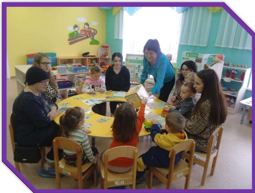
«Проверь свои знания»